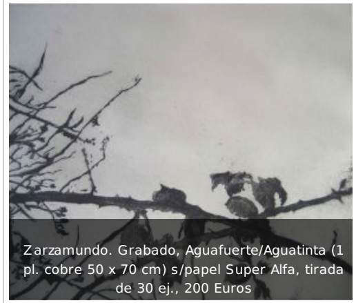
Zarzamundo. Grabado, Aguafuerte/Aguatinta (1 pl. cobre 50 x 70 cm) s/papel Super Alfa, tirada de 30 ej., 200 Euros